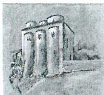
chiesa di San Marco (metà dell'XI secolo)

ISTITUTO COMPRENSIVO A. AMARELLI VIA GRAN SASSO n. 16 - 87067 ROSSANO - TEL.0983/512197 - FAX 0983/291007